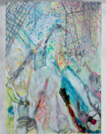
endfallen - Mischtechnik auf Papier - ca 150 x 130 cm - 2015